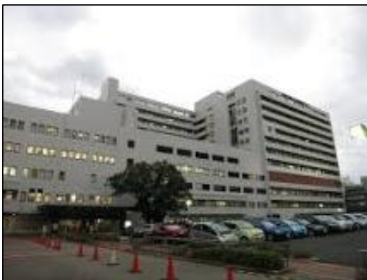
大阪医療センター外観

三大疾患である、がん・心臓病・脳卒中をはじめ、エイズやC型肝炎などの感染症や、高度救急救命医療・災害医療などの幅広い領域の疾患を取り扱う独立行政法人国立病院機構が運営する病院。臨床研究センターを有し、新薬や新しい医療機器の開発のために欠かすことのできないプロセスである治験にも積極的に取り組んでいる。2018年3月に大阪商工会議所と連携協定を締結し、医療機器の事業化促進を目的として医療従事者によるユーザー評価事業、病院見学会などの、企業の医療機器開発を促進させる取り組みを開始した。