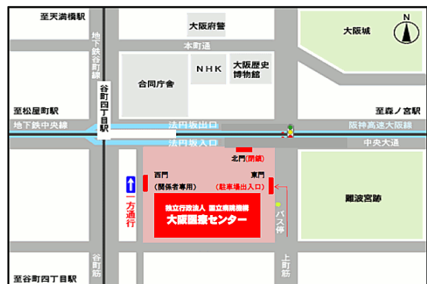
大阪医療センターアクセスマップ