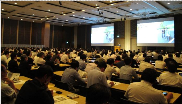
9月にキックオフ事業として実施した「スポーツハブ KANSAI」のビジネスマッチングには380社545人が参加した。

[成果・実績]「スポーツハブ KANSAI」には、433社・団体、665人が登録、274件の事業提案があり、143件の個別面談を実施した。