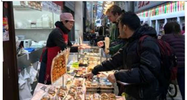
出前講座の実践編として、外国人留学生が観光客役として各店を回り実地指導する「外国人留学生ロールプレイング研修」を実施した。

[成果・実績]「外国人接客出前講座」には8団体81人、「外国人留学生ロールプレイング研修」には7団体53店舗が参加した。