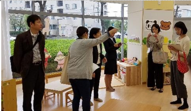
9、10月に企業主導型保育施設の見学会・情報交換会を3回開催し、延べ24人が参加、共同利用契約が2件成立した。

[成果・実績]フォーラム・セミナー・見学会・情報交換会には、延べ746人が参加した。企業主導型保育施設の共同利用契約が2件成立した。