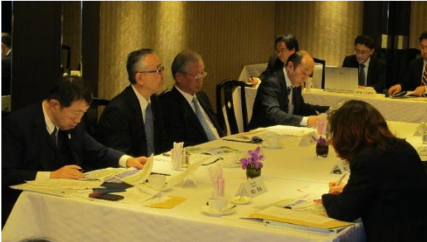
2月、手代木功本会議所副会頭は「京阪神三商工会議所ライフサイエンス振興懇談会」に出席し、「関西ウェルネス産業振興構想」をとりまとめた。