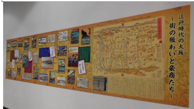
3月、経済都市として発展してきた江戸時代の大阪の姿を紹介する展示パネル「江戸時代の大阪：街の賑わいと豪商たち」を設置した。

[成果・実績] 来館者数は2万2,691人、累計入館者は28万884人になった。海外からの来館者は全体の12%。各種講座のうち、企業向けは591人、個人向けは834人が参加した。出前授業は22校3,603人を対象に実施した。